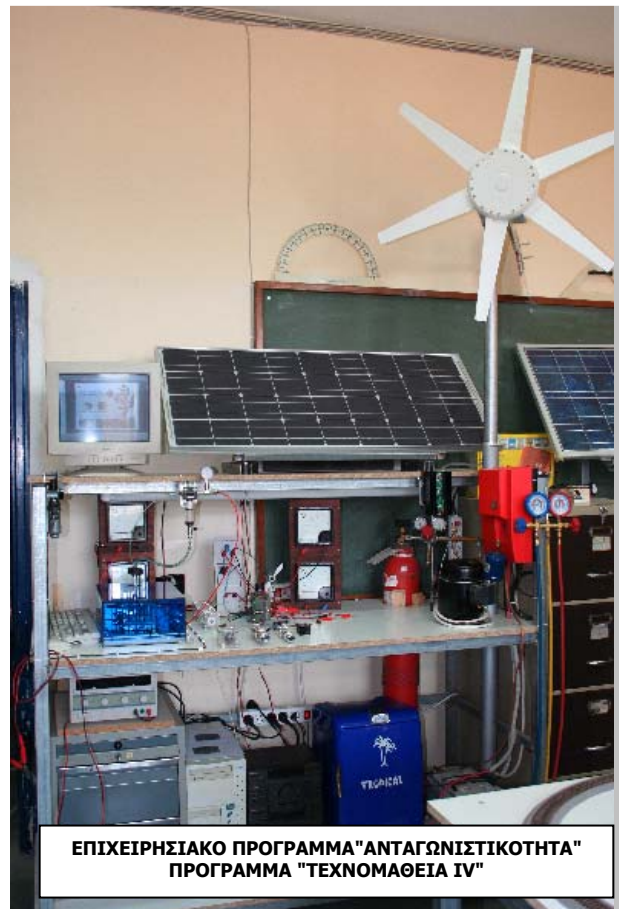
ΕΠΙΧΕΙΡΗΣΙΑΚΟ ΠΡΟΓΡΑΜΜΑ "ΑΝΤΑΓΩΝΙΣΤΙΚΟΤΗΤΑ" ΠΡΟΓΡΑΜΜΑ "ΤΕΧΝΟΜΑΘΕΙΑ IV"

ΜΕΤΡΟ 4.4: Ευαισθητοποίηση του κοινού στις νέες τεχνολογίες. Υποστήριξη και διαμόρφωση Ε&Τ πολιτικής. Διαχείριση Ε & Τ πληροφοριών. Δράση 4.4.3: Πρόγραμμα ΤΕΧΝΟΜΑΘΕΙΑ Πράξη 4.4.3.2: ΤΕΧΝΟΜΑΘΕΙΑ IV - Πρόγραμμα για τη γνωριμία και την ενασχόληση των μαθητών της Δευτεροβάθμιας Εκπαίδευσης με τις νέες τεχνολογίες και τον Τεχνολογικό Πολιτισμό